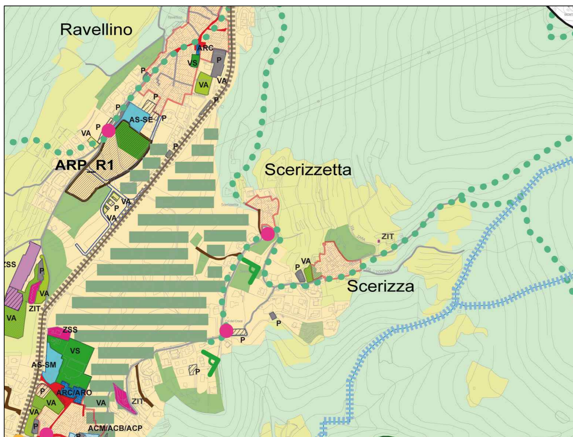
Estratto di P.G.T. - Piano Dei Servizi scala 1:5000